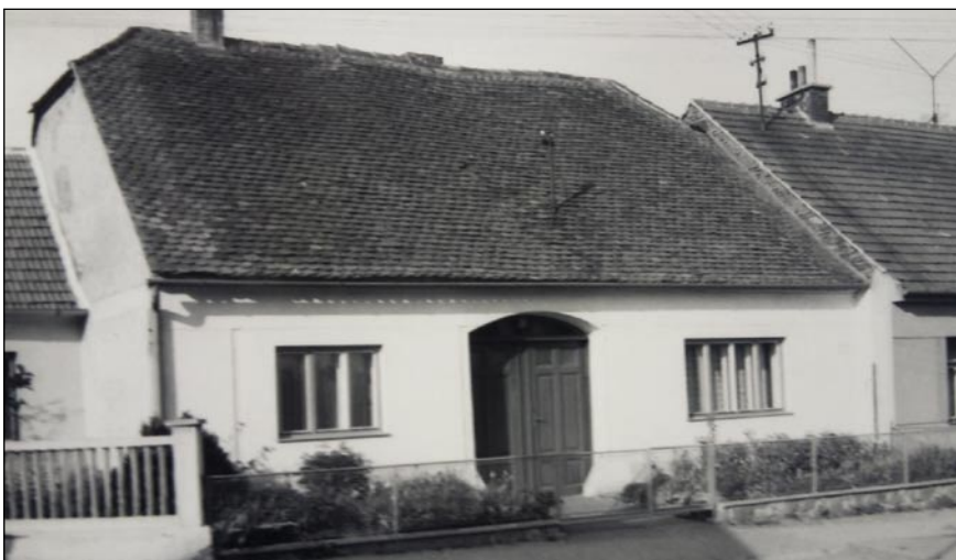
Počátky domu sahají až do doby pánů z Lipé. Byl tu ovčín a oblíbená noclehárna formanů (stavěli tu před branami města) a poutníků až do Terstu, Benátek a Říma. Dnes je původní stavení zbouráno a nové je ve výstavbě.