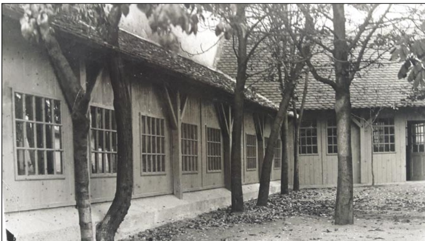
Při restauraci „Blížkovský“ byla zřízena kuželna, místo pro velmi oblíbený sport, který se rozšířil v 2. polovině 19. stol. Byl provozován a vyhledáván po celý rok. Školák Bohumír tam ve volných chvílích chodil, aby stavěl pokácené kuželky a vracel hrací kouli dřevěným žlábkem od kuželek k hráčům.