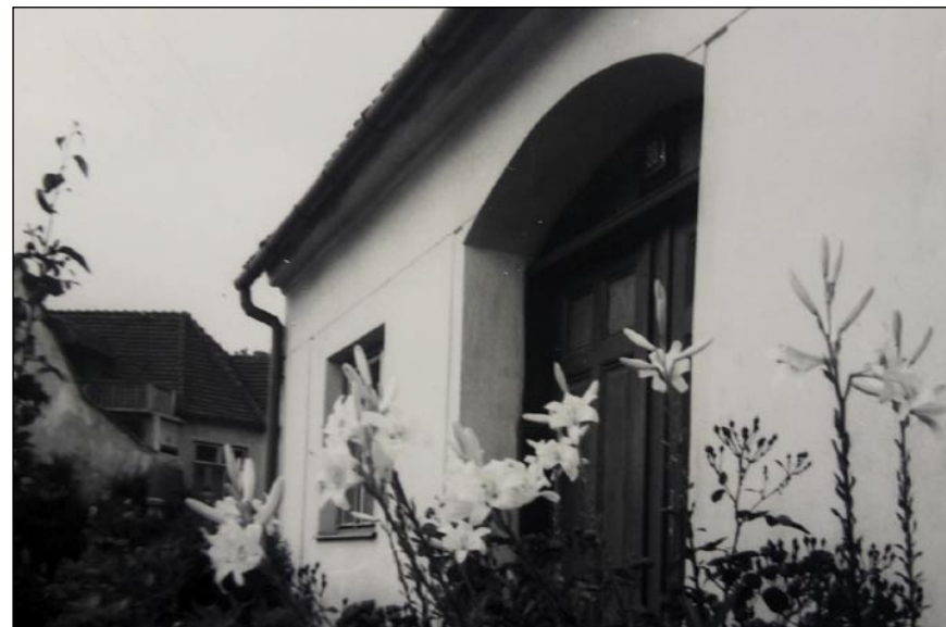
Skupina kvetoucích lilií je vzpomínkou na to, co všechno tady bylo - a již není.