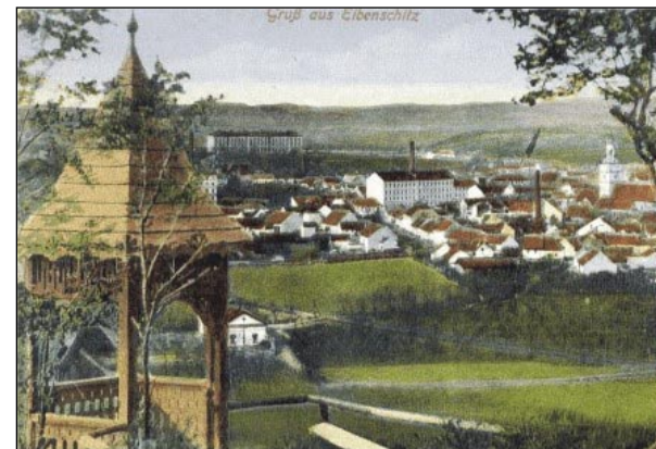
Stará rozhledna Alfonse Muchy, přestavěná roku 1930, stojí na lesnatém svahu kopce Rény a poskytuje návštěvníkům utěšený pohled na Ivančice a okolí.

„Cestička k domovu známě se vine, hezčí je, milejší, než všechny jiné. A kdybych ve světě bůhvíkam zašel, tu cestu k domovu vždycky bych našel“.